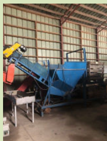
Videur de boîte avec réserve à 5 500 $