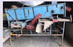
Crible 24 pouces à pomme de terre 4 sorties et plusieurs passes.