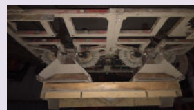
Coupeuse de pommes de terre Elle coupe en trois doubles.