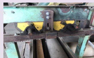
Coupeuse de pommes de terre Coupeuse en deux avec rouleaux presque neufs.