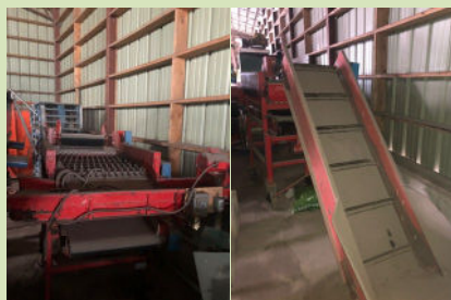
Crible à étoiles à 1 800 $